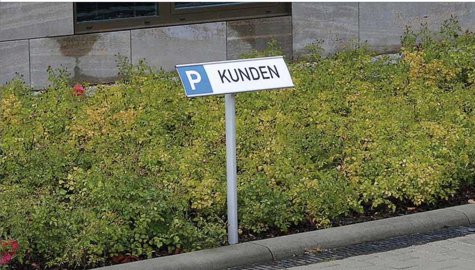
Parkplatzschild mit Kombiteil – Nutzung als Erdspieß