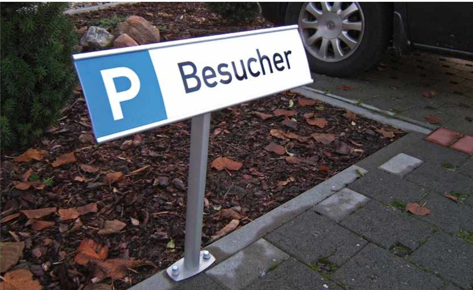
Parkplatzschild mit Kombiteil – Nutzung als Flansch zum Aufdübeln