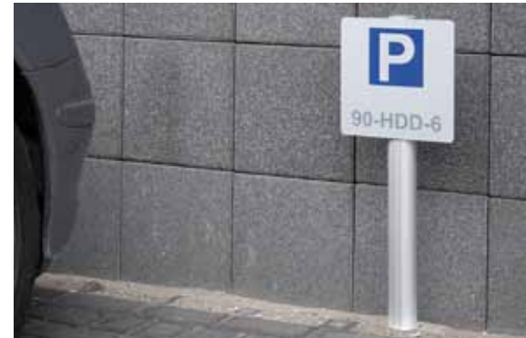
Hinweisschild mit Säule des Aufstellersystems