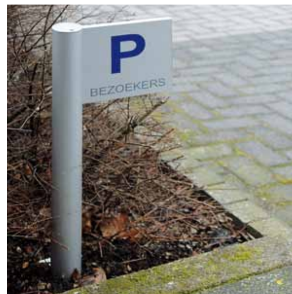
Textpaneele könne auch einseitig auskragend an den Säulen angebracht werden.