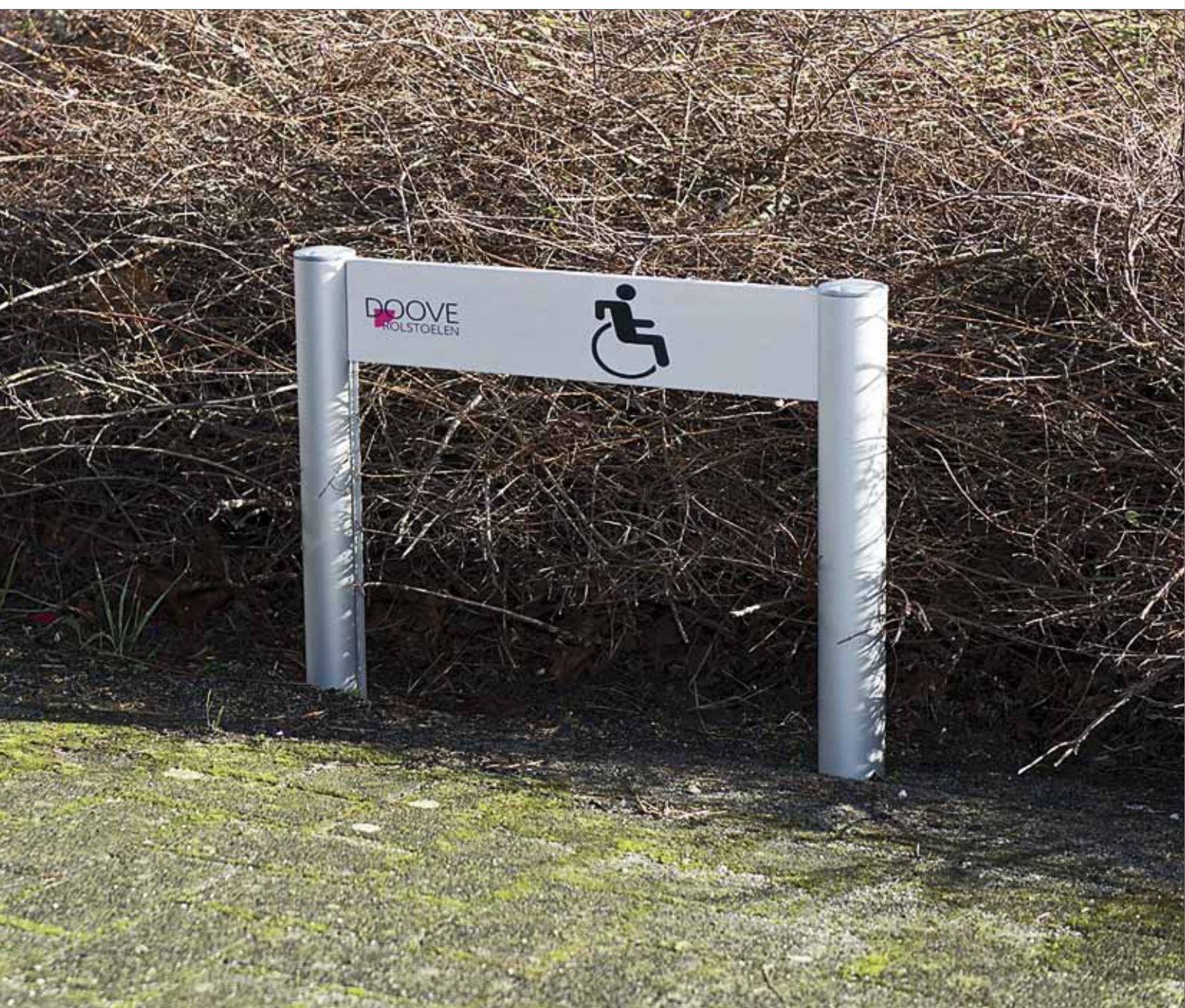
Parkplatzschild mit 2 Säulen des Aufstellersystems und 1 Textpaneel