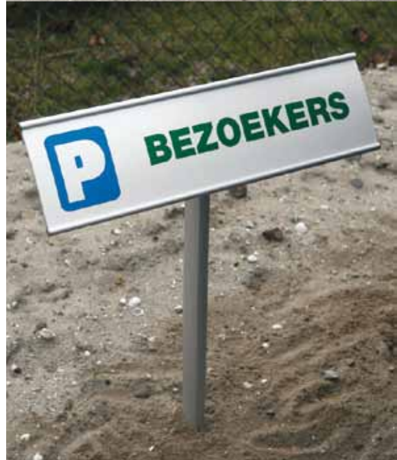
Nutzung des Kombiteils als Erdspieß