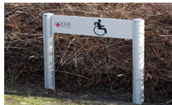
Kleinere Aufsteller für Parkplätze oder Grünanlagen können mit allen Säulen des Aufstellersystems in Kombination mit Textpaneelen eingesetzt werden.