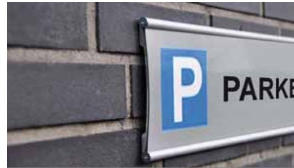
Hinweisschild mit System PRIMUS-Wegweiser