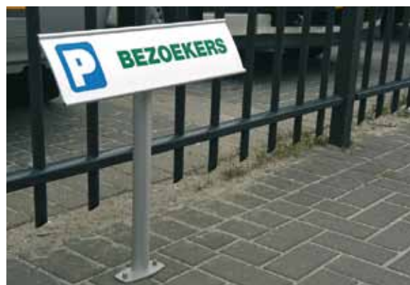
Nutzung des Kombiteils als Flansch zum Aufdübeln