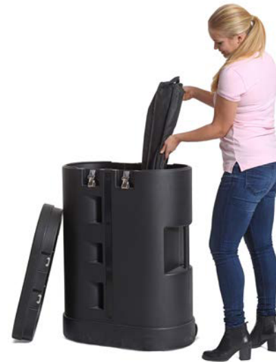
Bitte beachten: Dieser Verwandlungskünstler hat keine Innenablagen.

Unsere Hartschalencontainer auf Rollen, die wir für den Transport unserer SnapUp Backwalls entwickelt haben, eignen sich auch als Theke. Mit einer Abdeckplatte aus Holz und einer Grafikummantelung verwandelt sich der Container im Nu in eine Theke.