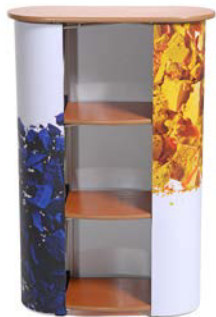
Jede Menge Stauraum durch Innenregale.

Die Minitheke ist im Vergleich zu unseren Rezeptionstheken viel kleiner, aber immer noch groß genug als Treffpunkt oder für eine Demonstration. Sie besteht aus einer Pop-Up-Struktur, die von einer Grafikbahn ummantelt wird.