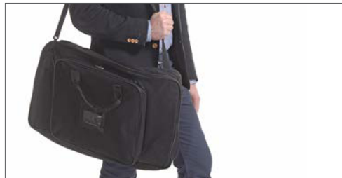
Die Mini-Theke ist ein Leichtgewicht und kann entsprechend einfach in unserer Schultertasche transportiert werden.